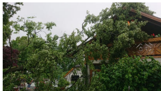
Unwettereinsatz am 07.06. in Markersdorf