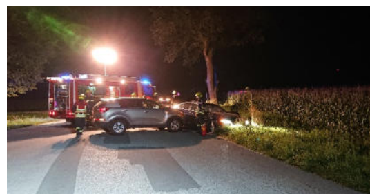
Unfall auf der Haindorferstraße, 28.08.