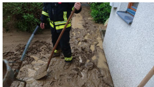
Unwettereinsatz am 07.06. in Haunoldstein