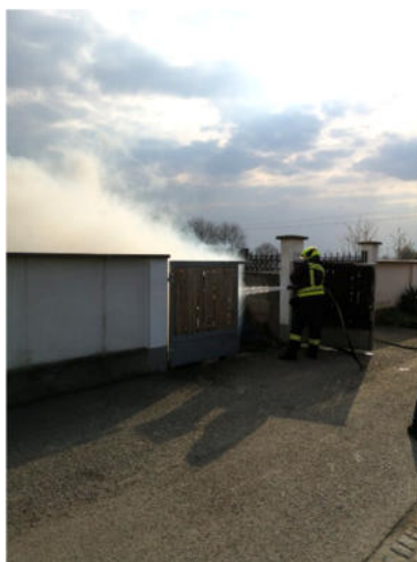
Brand am Friedhof, 29.03.